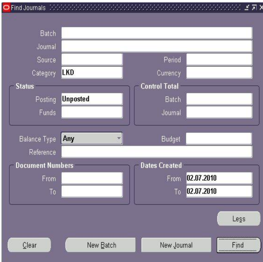
Mynd: "Find Journals"